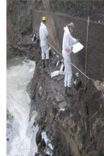
MILIEU KWALITEIT BODEM