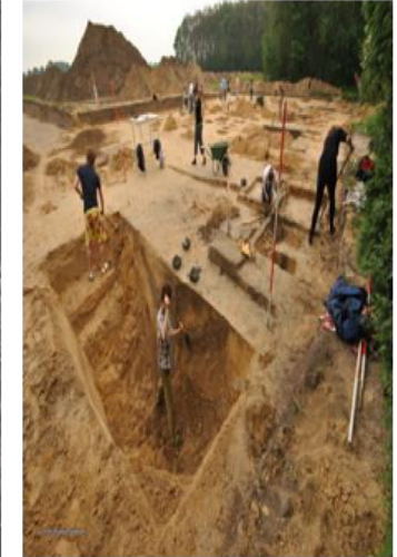
CULTUUR HISTORISCHE WAARDEN

← Huidige scope programma BRO FASE I 2017-2021 → ← BRO FASE II 2022 -2025 →