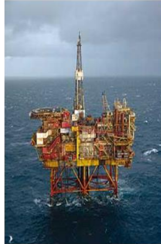
NATUURLIJKE BESTAANS- BRONNEN